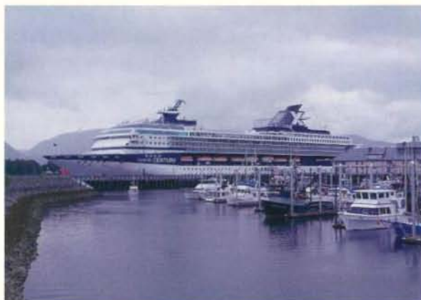
ALASUKA 高口眞一路 (福岡)