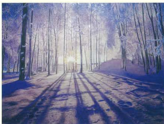
冬の森の光と影 穂積健一 (大阪)