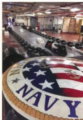
NAVY 松本佳巳 (大阪)