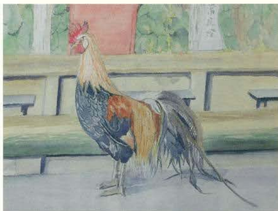
石上神社の尾長鶏 江並 隆 (大阪)