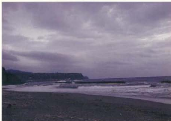
低気圧接近 黒河内軍治 (仙台)