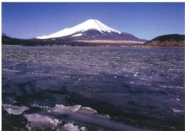
厳冬の霊峯 松本吉司 (東京)