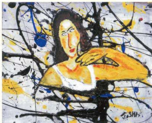
見つめる女 大屋俊郎 (東京)