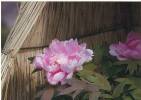
冬に咲く 市中滋郎 (東京)