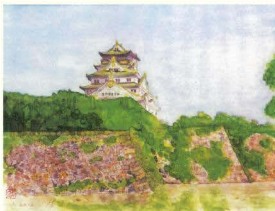
盛夏の大阪城公園 花田貴宣 (東京)