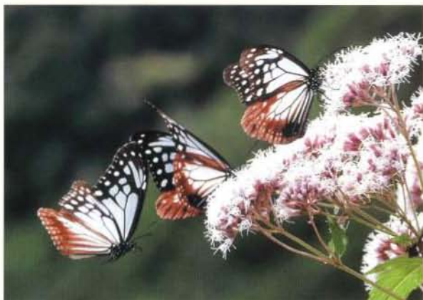
遠来のいのち 河村信弘 (大阪)