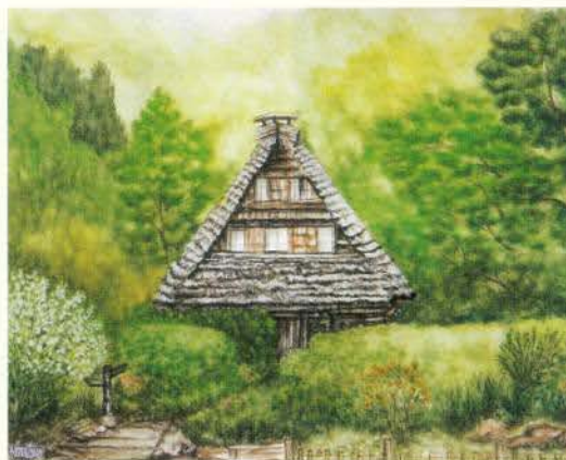
春彩生田民家園 松尾 宏 (東京)