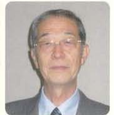
一、私は若い時から腰痛に悩まされ、手術をした時には半年間休職し、その後のリハビリが大変でしたので②趣味を楽しむ、ものを作る事が好きでステンドグラスの創作を始め、出来上がった時、初めて光を通して見た時の感動は最高で、その魔力に嵌っています。大きいものと1年以上かかります。③自立した生活力、現役時代に3年間単身赴任をしましたが自炊をしようと鍋釜一式を用意して、終わってみれば味噌汁を作ったぐらい、もしもの時を考えると料理教室に通い、麺、魚、もてなしコースなど10コースを終え今はパンを焼くコースをやっています(1コース1年)。気が向いた時、月に何度か料理を作り、麵をうったりしますがこれも楽しいものです。

「光陰矢のごとし」退職して早11年が過ぎてしまいました。定年退職時に決めた目標が①健康第