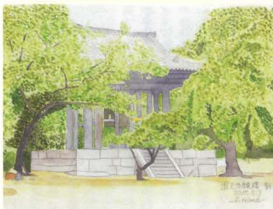
増上寺鐘楼 新緑 石川黎明 (東京)