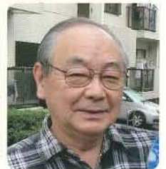
今でも皆さんの顔をはつきり思い出します。その節は大変お世話になりました。うございました。

アステラス製薬の誕生前年十一月に山之内で定年を迎えてから早いもので十一年が過ぎました。この原稿を書いていると沢山の方々との出会いがあり